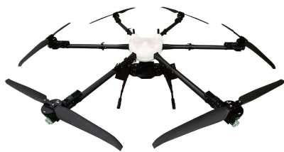
※写真の機体は EAGLE77 です。